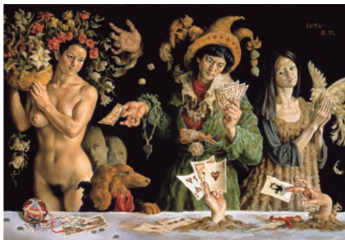
《賭けをする人達》昭和51(1976)年 茅ヶ崎市美術館蔵