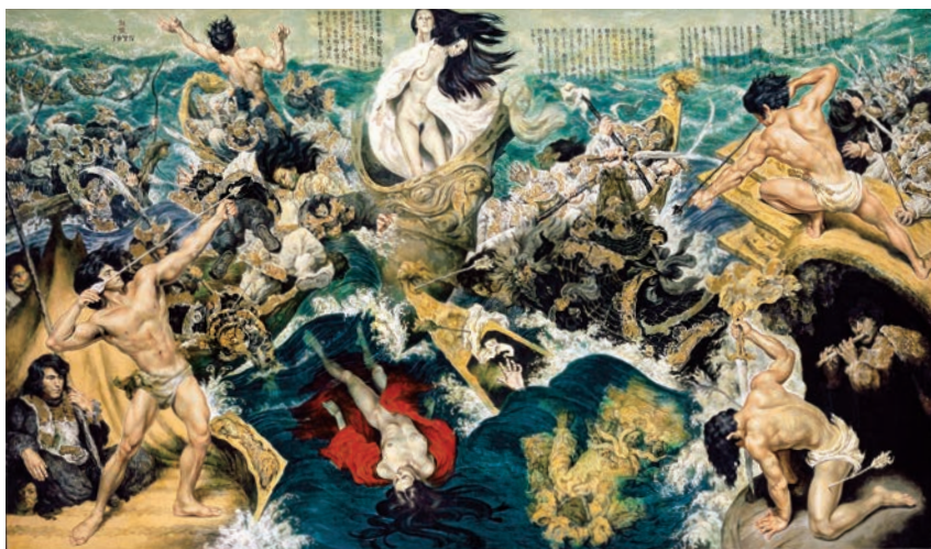
《海と戦さ(平家物語より)》昭和50(1975)年 個人蔵