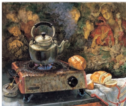
《ガスコンロと静物》昭和45(1970)年 個人蔵

本展は生誕100年を記念した大々的な展覧会です。コレクターの方々から秘蔵する作品により、昭和時代を駆け抜けた牧野の画業を振り返るとともに、その作品の意義を現代に問いかけます。牧野邦夫は、モダニズムなど眼中になく、終生、ある意味愚直に描き続けた人でした。そんな彼の絵描き魂が召喚され、この令和の時代に、昭和の画家が甦ります。