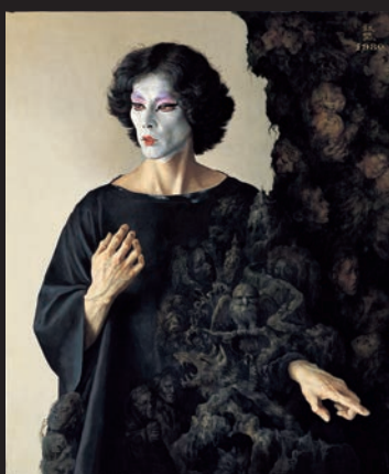
《舞踏家大森政秀の肖像》昭和55(1980)年 個人蔵

担当＝小澤由季(本展担当学芸員) 日時＝5月2日(土)、5月31日(日) 14:00～14:50 会場＝展示室 料金＝無料(申込不要、要観覧券)