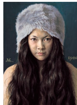
《千穂の顔》昭和55(1980)年 個人蔵