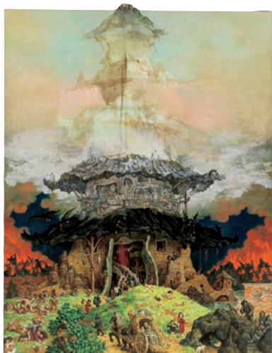
《未完成の塔》未完成 個人蔵(練馬区立美術館寄託)