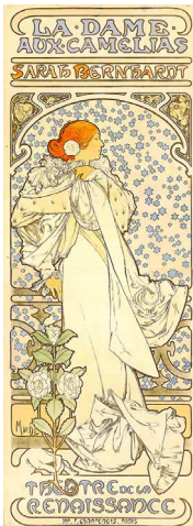
《椿姫》1896年 OGATAコレクション