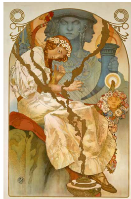
《スラヴ叙事詩展》1928年 OGATAコレクション