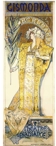
《ジスモンダ》1895年 OGATAコレクション