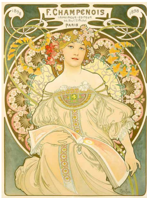
《夢想 シャンプノア》1897年 OGATAコレクション