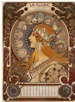
《黄道十二宮 ラ・プリュム誌のカレンダー》 1896年 OGATAコレクション