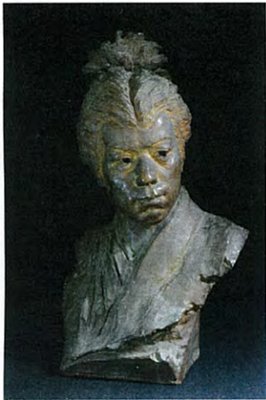
レオポルド・ベルンスタン 「音二郎像」1900年 成田山貞照寺蔵