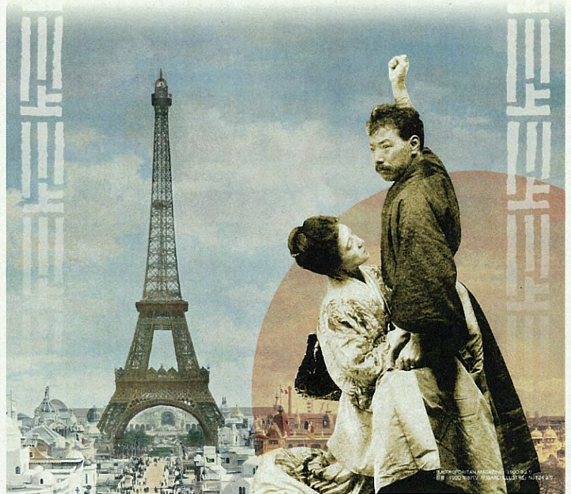
・『METROPOLITAN MAGAZINE』1900年より ・背景：1900年のパリ『FIGARO ILLUSTRÉ』No.124より

新発見資料をはじめ国内外の貴重な美術作品などをとおし、多くの方に川上夫妻の知られざる物語に触れていただきたいと思います。