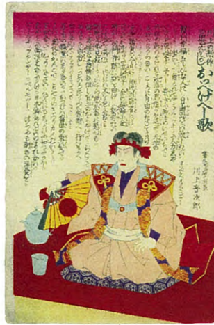
永島春暁 「川上の新作 當世六さがし おっけべー歌」 1891年 個人蔵