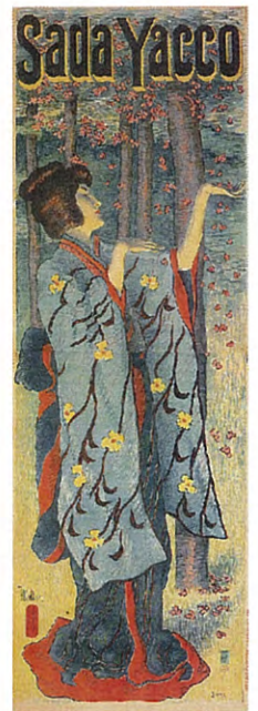
ミュッラー 「サダヤッコ」1900年 京都工芸繊維大学 美術工芸資料館蔵