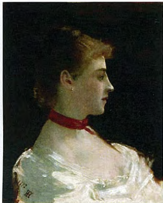
山本芳翠 「西洋婦人像」1882年 東京藝術大学大学美術館蔵