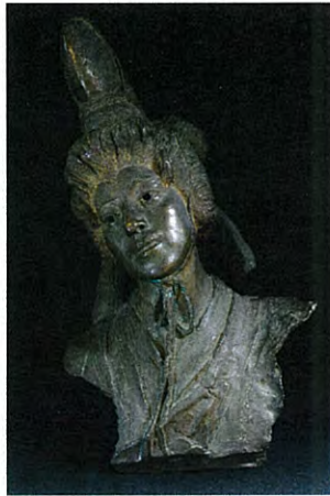
レオポルド・ベルンスタン 「貞奴像」1900年 成田山貞照寺蔵