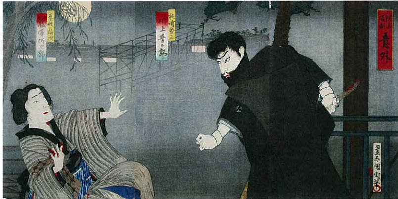
豊原国周「川上演劇 意外」1894年 個人蔵