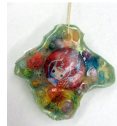
ビーズ入りオーナメント！